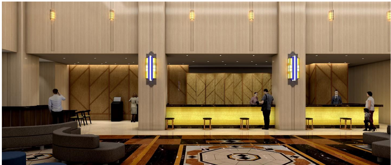
ロビー完成イメージ

新たなフロントデスクは“金色”を基調とし、東京・池袋という都市にあるホテルとしての華やかさや艶感、メトロポリタンホテルズのフラグシップホテルとしての品格や洗練された空間を表現します。国内外のお客さまがいらっしゃるホテルとして、フロントデスク後方には金屏風をイメージした壁を設え、日本文化の要素を取り入れます。また、長年の歴史が刻まれたロビーの床面の大理石や柱の照明などの一部はそのまま残し、新旧を融合させることで 50 年、100 年と、引き続きお客さまに愛されるホテルを目指し生まれ変わります。