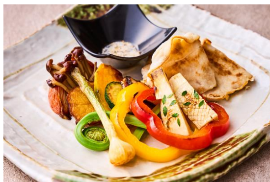
『月替わりの炭火焼き ( ¥ 3,400) 』 春筍の炭火焼きと香り豚の焼きしゃぶ