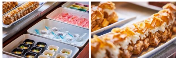
デザートビュッフェイメージ