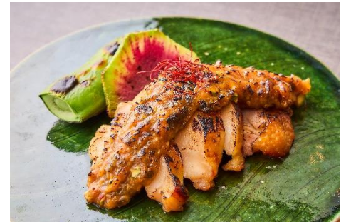
【鶏肉】つくば鶏のふき味噌焼き