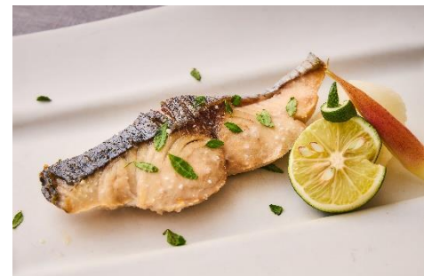
【旬魚】鯖の木の芽焼き