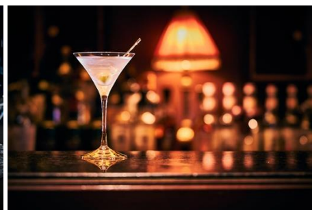
バー「オリентエクスプレス」