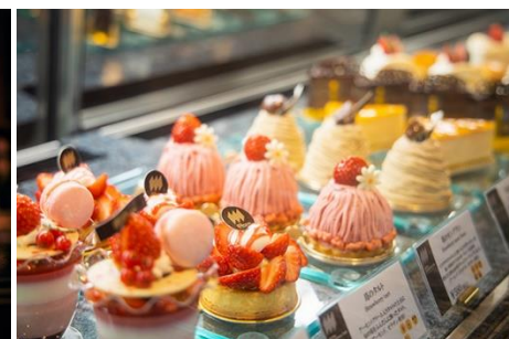
ケーキ＆ベーカリーショップ