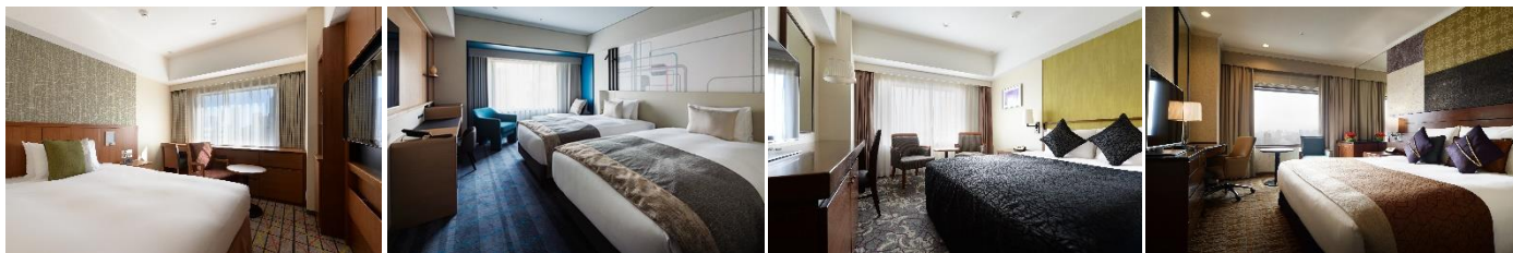
スタンダードシングル (17㎡)