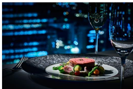
キュージーヌ「エスト」