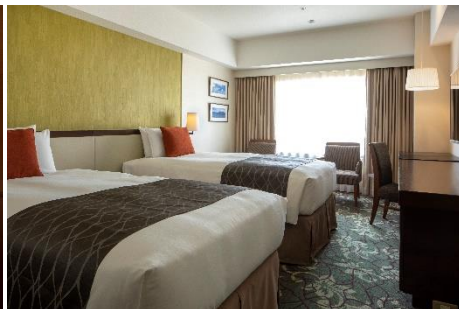
スーペリアツイン（23㎡）