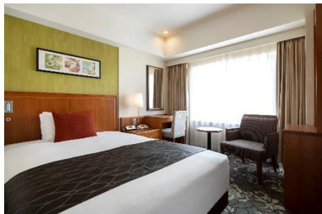
スーペリアシングル（17㎡）