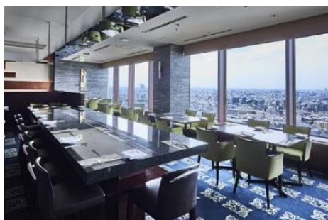
ホール席イメージ①

最大 8 名様ご利用いただける、プライベート感のある落ち着いた個室もご用意しており、気の合うご友人たちやご家族との会食や、カジュアルな顔合わせの御席にもおすすめです。