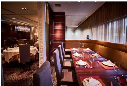
個室「雪・花・月」（8～12 名）