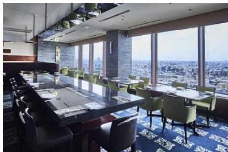
ホール席イメージ①

最大 8 名様ご利用いただける、プライベート感のある落ち着いた個室もご用意しており、気の合うご友人たちやご家族との会食や、カジュアルな顔合わせの御席にもおすすめです。