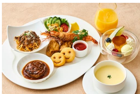
七五三セット ¥ 3,800