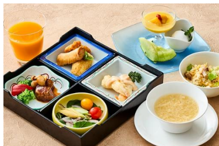
七五三セット ¥ 3,800