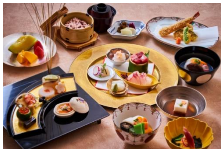
お祝い会席「寿」 ¥ 16,000