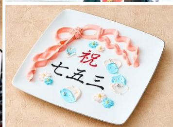
ホテルパティシエ特製 お祝いメッセージプレート