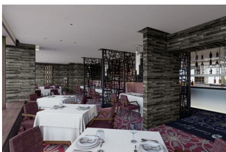
キュージーン「エスト」