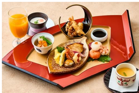
七五三膳 ¥ 3,800/ ¥ 5,300 (鯛のお頭付き)