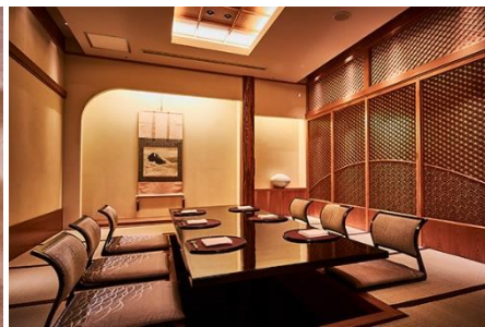
個室一例「扇」(掘りごたつ式)

七五三膳は、可愛らしい手毬寿司や海老フライ、鶏の唐揚げ、焼き魚などを盛り込みました。ご家族の皆様には縁起の良い食材を取り入れたお祝い会席「寿」がおすすめです。掘りごたつ式の座敷個室や“和”をコンセプトにしたモダンなテーブル個室など、様々なタイプの個室をご利用いただけます。