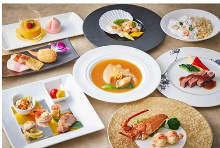
お祝いコース「寿」 ¥ 16,000