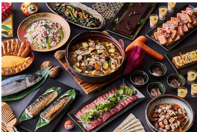
オールデイダイニング「クロスダイ」 ランチ＆グランドディナービュッフェ