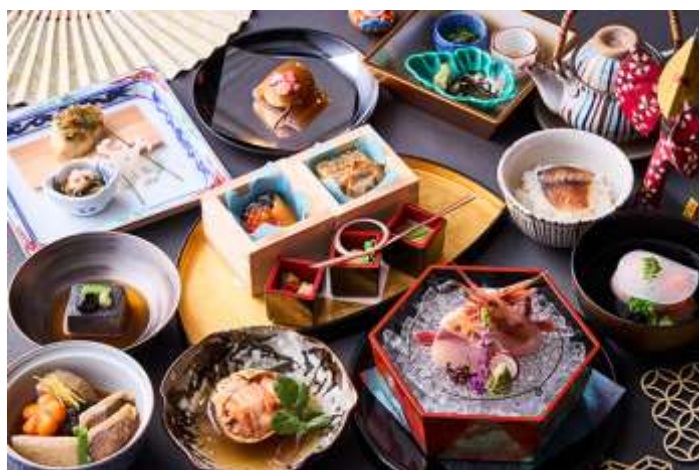
日本料理「花むさし」 料理長特別会席／ランチ御膳「宝珠」