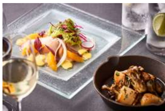
ダイニング＆バー「オーヴェスト」 一品料理