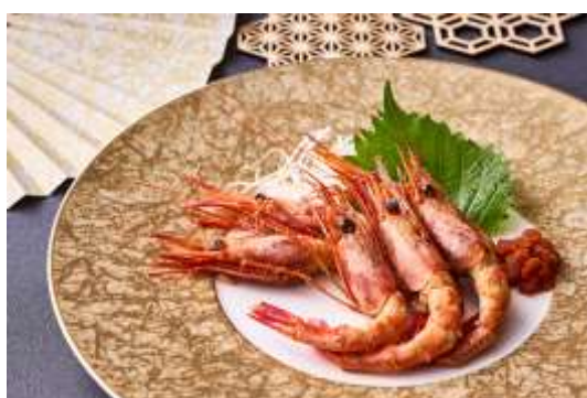
中国料理「桂林」 一品料理