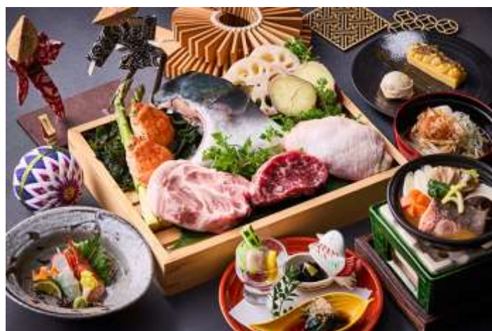
四季彩茶寮「旬香」 四季彩コース／一品料理