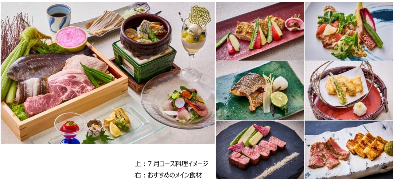
上：7月コース料理イメージ 右：おすすめのメイン食材

前菜は、瑞々しい“ズッキーニ”や“ゴーヤ”など夏野菜を使い、暑い日でも食欲をそそる一皿に仕上げました。造り替りは、脂のり旨みが増した旬の“かんぱち”を甘海老と合わせ涼やかなサラダ仕立てにしました。小鍋は、淡泊ながらもコクのある“ずすき”をあさりと一緒にワイン蒸しにすることで、魚介の旨みを存分に堪能いただける一品になっています。メイン食材は、“丹波あじわいどり”や“安曇野げんき豚”、旬の“いさき”や“穴子”などの厳選した銘柄豚や鶏、旬魚をそれぞれの持ち味を活かす最適な調理法でご提供いたします。コースの締めくくりには、メロンの果肉、クリーム、ジュレを重ね、爽やかなハーブをアクセントに添えたパティシエ特製のヴェリーヌをご堪能ください。