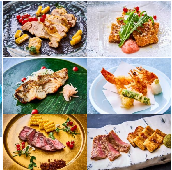
上：8月コース料理イメージ 右：おすすめのメイン食材