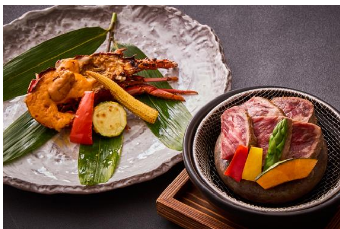
【強肴】イセエビの鬼殻焼き うに玉仕立て または 石焼き 国産牛サーロイン