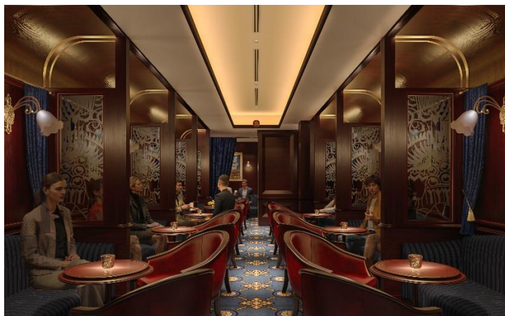
バー「オリентエクスプレス」イメージ