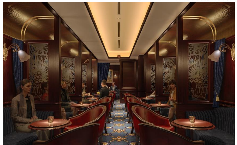
バー「オリエントエクスプレス」イメージ

ヨーロッパ大陸を横断した伝統の豪華列車「ベニス・シブロン・オリエント・エクスプレス」の車内空間をよりオーセンティックに再現いたします。見上げる天井の美しい曲線は、まさに本物の客車そのもののしつらえへ。開業から40年以上変わらない重厚感あるカウンターはそのままに、身をゆだねるベンチシートは、サロンカーの風格をより忠実に再現したデザインとなり、世界の銘酒と語らいが紡ぐ、優雅な旅のひとつときをお届けいたします。