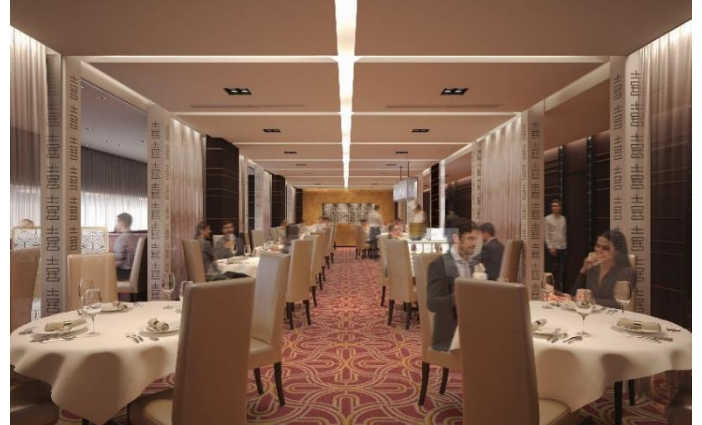
中国料理「桂林」イメージ

長年愛され続けた伝統の味と、シックモダンとオリエンタリズムが調和した洗練された空間美はそのままに、ダイニングでのご利用から慶事法事のご会食まで、シーンに合わせた個室を充実させ、より一層磨きかけた重厚感のある空間となりお客さまをお迎えいたします。さらに、ホールに2つの「パフォーマンステーブル」を設け、目の前で料理を取り分けるライブ感あふれる演出で、美食の時間をより華やかに盛り上げます。中国料理でありながら、ソムリエ厳選のワインとの素敵なマリージュもご堪能ください。