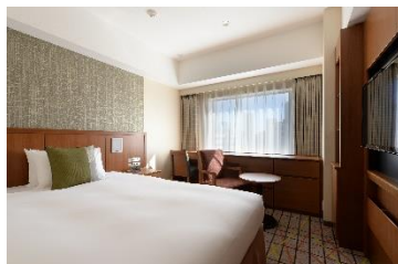
スタンダードスモールダブル (17㎡)