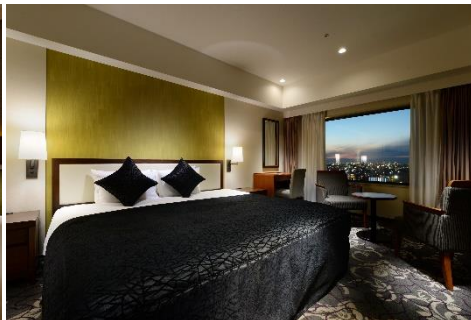
シティビューキングダブル