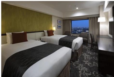
スーペリアツイン

ゆったりのにんびり過ごしたり、思い出話を語りながら過ごしたり、思い思いの過ごし方をお楽しみいただけます。さまざまなタイプのお部屋をご用意しております、ニーズに合わせてお選びください。