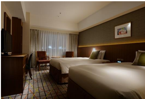
スタンダードツイン