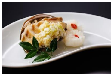
蝦夷鮑蒸し ねぎ生姜ソース