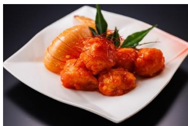
ロブスターテール 甘辛煮

牛肉黒味噌煮込み／つぶ貝のXO醬炒め 鶏肉の野菜巻き煮 くるみの飴炊き スモーク帆立貝／ロブスターテール 甘辛煮 蝦夷鮑蒸し ねぎ生姜ソース クラゲ甘酢漬け 飾り大根の甘酢漬け／ダックコース 飾り ゆり根甘露煮 南天 寿人參