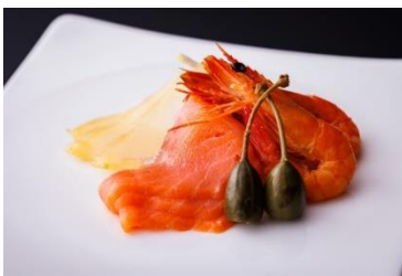
魚介スモーク3種 (サーモン 鯛 海老) ケッパーベリー