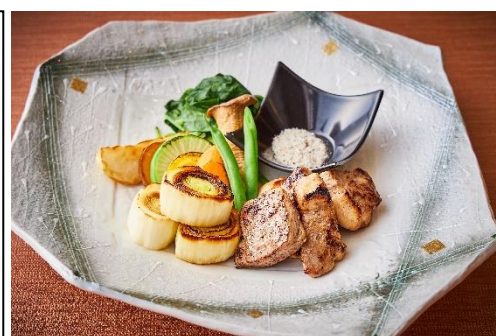
『月替わりの炭火焼き( ¥ 3,400)』 下仁田ねぎの炭火焼きと国産豚肩ロースの麩焼き