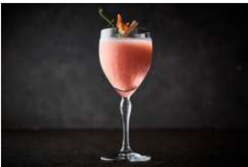
Lumière Pêche ルミエールペシェ

マンダリンと八朔の爽やかな甘みとシャンパンの ドライな飲み口が相まったカクテルです。