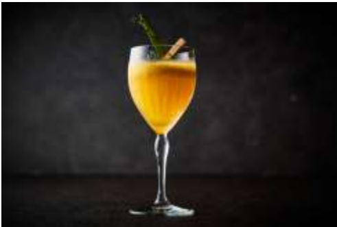
Soleil Orange ソレイユオランジュ