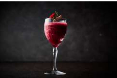
Espoir Cassis エスポワールカシス

<Pommery Brut Royal /Cassis purée/Raspberry/Syrup>